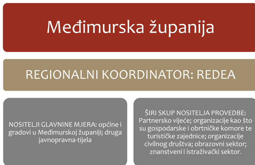
Slika 1. Dionici uključeni u provedbu Komunikacijske strategije

Provedba će slijediti temeljne ciljeve i smjernice strategije, a realizirat će se sukladno raspoloživim resursima i u suradnji s partnerskim institucijama i organizacijama prikazanim na donjoj slici.